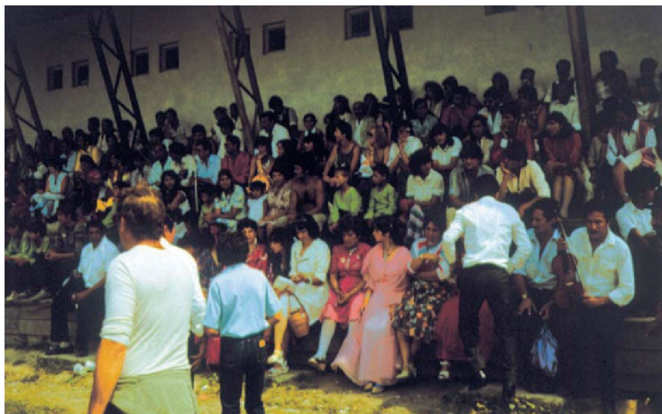
Na fotografii z panelu z výstavy (viz výše) je zachyceno dění v amfiteátru po skončení pásma Ludia z rodu Rómov – členové souborů a další vystupující se účastní slavnostního rozloučení | Východná 6. července 1986