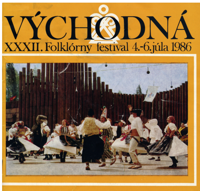
Titulní strana programového bulletinu k folklornímu festivalu Východná 1986

Pokud jde o samotné období druhé poloviny osmdesátých let, začalo tehdy docházet – na sklonku tzv. normalizace – k postupnému politicko-spoločenskému uvolňování. Tento vývoj souvisel zejména s nástupem Michaila Gorbačova do čela Sovětského svazu a s jeho reformní politikou „perestrojky“ (přestavby). 12 V jejím důsledku se začaly otevírat možnosti znovu formulovat dříve odmítané požadavky a hledat způsoby, jak prosadit menší i zásadnější